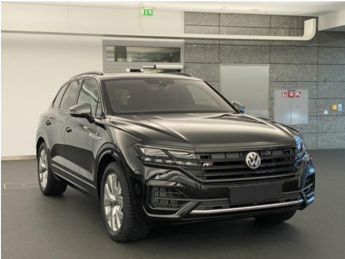
Abholung in der Autostadt am 09.12.2019