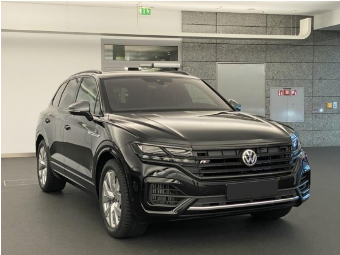
Abholung in der Autostadt am 09.12.2019