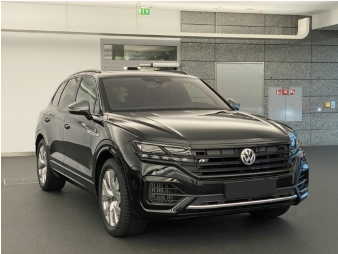
Abholung in der Autostadt am 09.12.2019