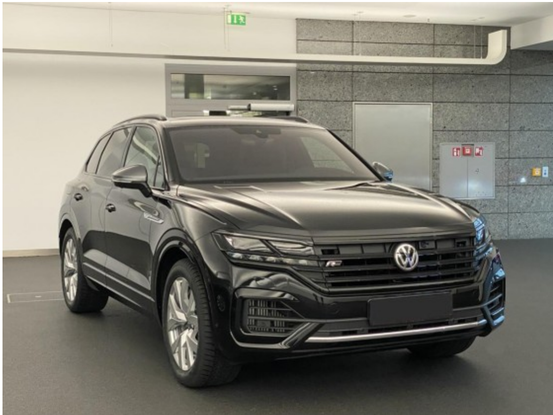
Abholung in der Autostadt am 09.12.2019