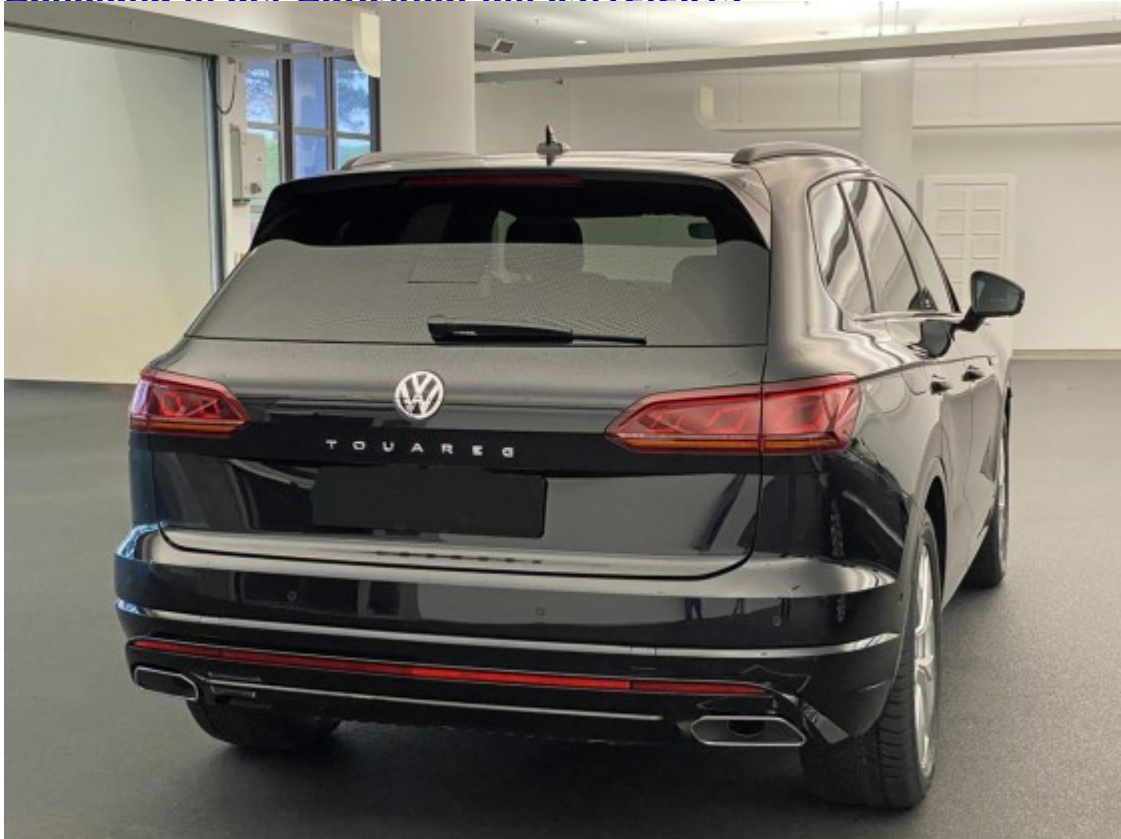
Abholung in der Autostadt am 09.12.2019