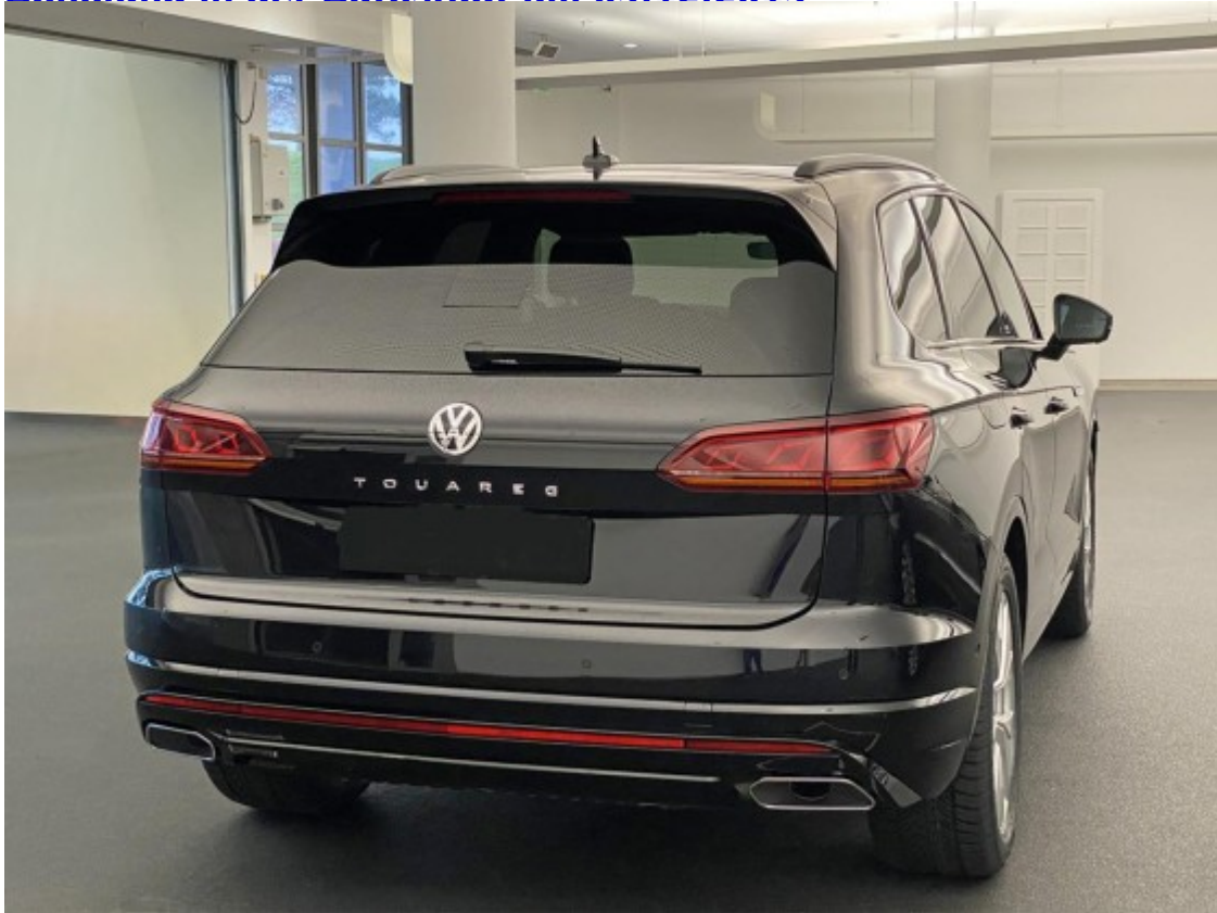
Abholung in der Autostadt am 09.12.2019